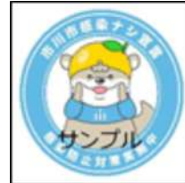
※2 感染防止対策取組宣言ステッカーイメージ