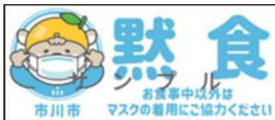
※1 黙食推奨ステッカーイメージ